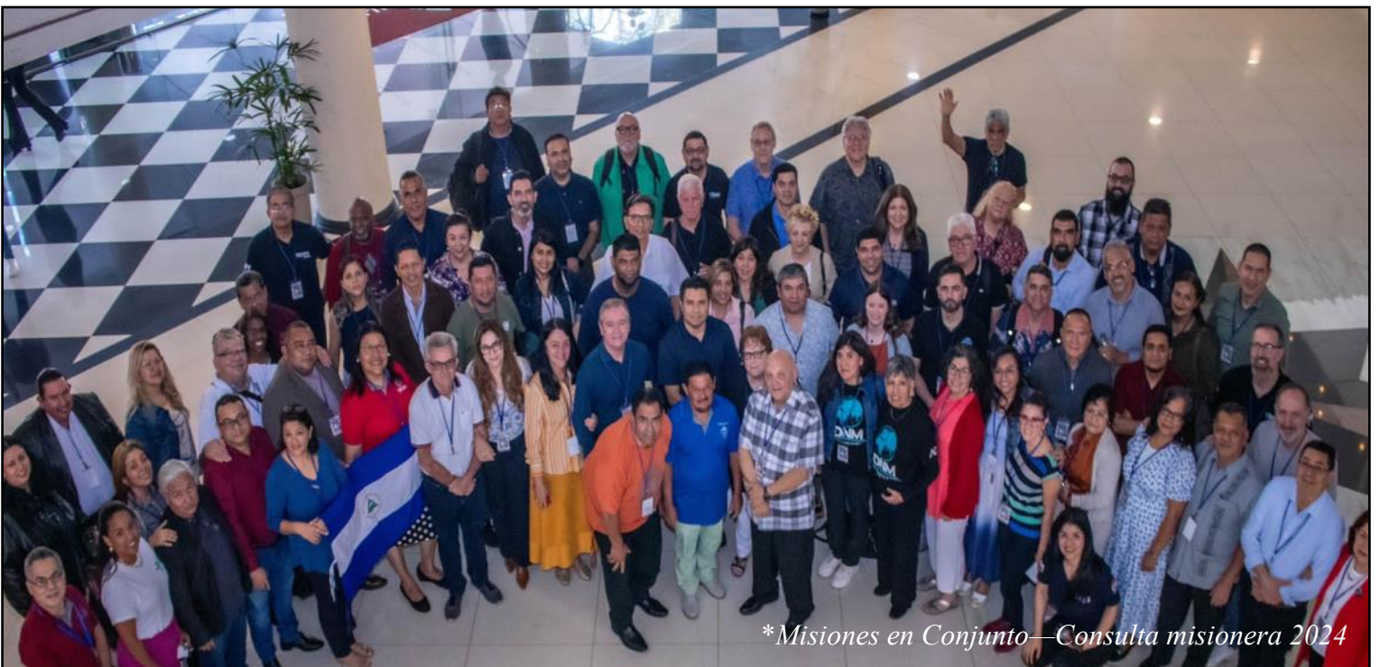
*Misiones en Conjunto—Consulta misionera 2024

Jesús, tu llamado está arraigado en mi corazón Una voz suave que susurra en el corazón. Un llamado de amor Qué llamado tan santo y sabio... Me atrevo a decir: ¿Quién crees que soy? ¡Un fiel servidor! Aquí está tu hijo, Señor, envíame ahora. No rechazaré tu llamado Estoy listo para ir a donde me envíes Sé que el camino será difícil, La misión a la que me envías Puede ser un bosque denso y oscuro que hay que atravesar, Y puede haber muchos animales salvajes, La prueba será ir por un camino estrecho. Estoy listo para ser tu mensajero, Entonces, Señor, envíame.