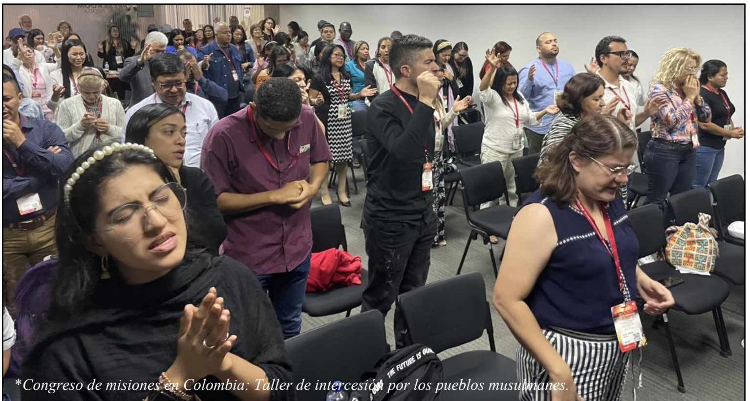
*Congreso de misiones en Colombia: Taller de intercesión por los pueblos musulmanes.

Mientras crecía en nuestra granja, ayudaba a mi papá a cortar heno. Él a menudo me decía: “Necesitamos terminar este trabajo hoy. No te vayas del campo hasta que el trabajo esté terminado.” Nuestro Padre celestial nos dice lo mismo a nosotros. Tenemos una tarea que hacer, y los campos están maduros para la cosecha. ¡Debemos permanecer en el campo, aferrados al arado y terminar el trabajo! “La noche viene, cuando nadie podrá trabajar” (Juan 9:4).