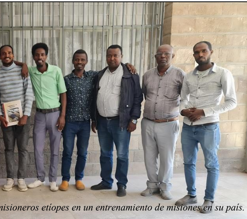
misioneros etíopes en un entrenamiento de misiones en su país.